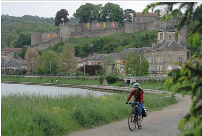
Mosel-Radweg in Frankreich