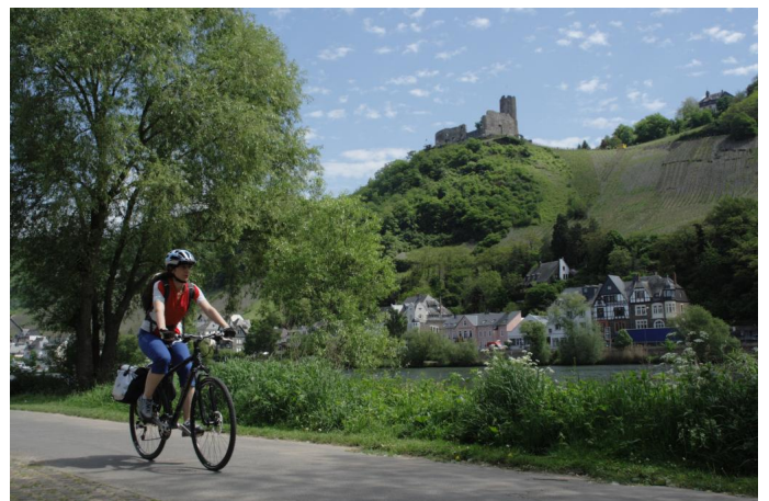
Mosel-Radweg bei Bernkastel-Kues