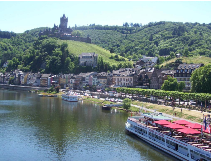
Cochem mit Reichsburg