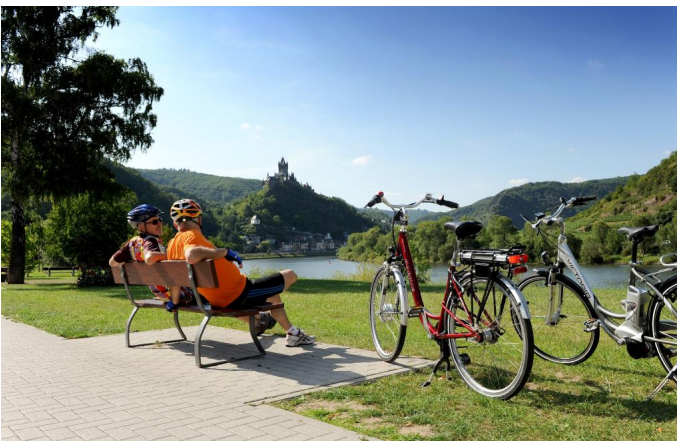
Auf dem Mosel-Radweg in Cochem