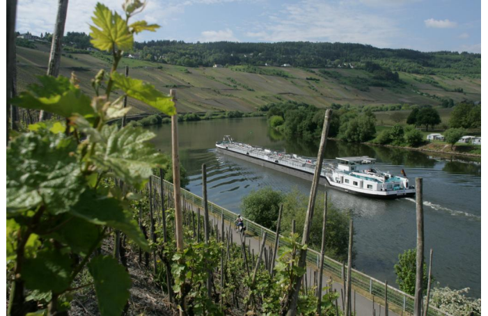
Mosel-Radweg bei Trittenheim