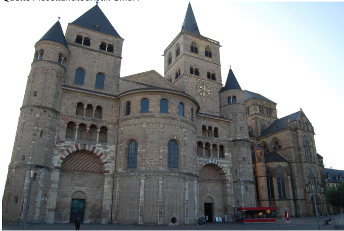
Dom in Trier Autor Mosellandtouristik GmbH Quelle Mosellandtouristik GmbH