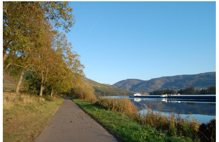
Mosel-Radweg bei Lieser