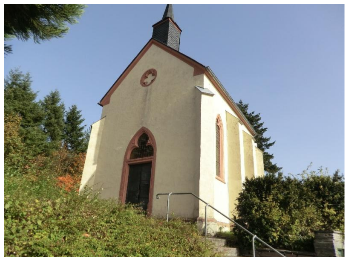
Kröver Bergkapelle Autor Thomas Kalff

Autor Thomas Kalff Quelle Mosellandtouristik GmbH