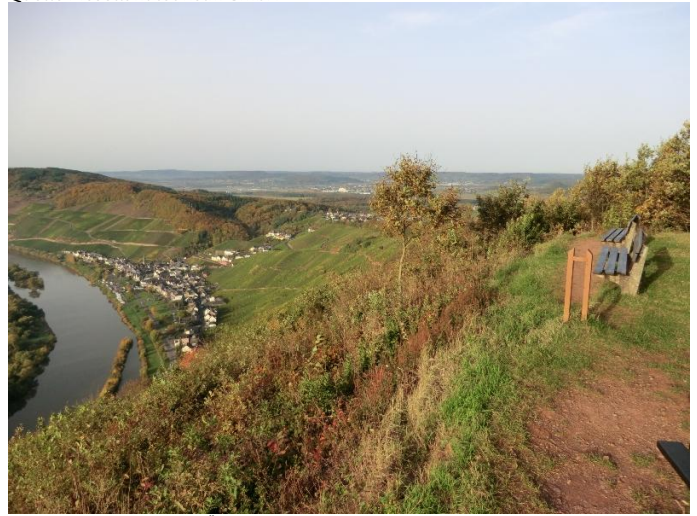
Blick vom Burgberg auf Ürzig und über den Kamm der Moselberge hinweg bis ins Wittlicher Tal

Autor Thomas Kalff Quelle Mosellandtouristik GmbH