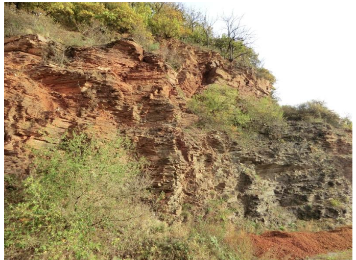
Schiefereinschluss am Kröver Berg