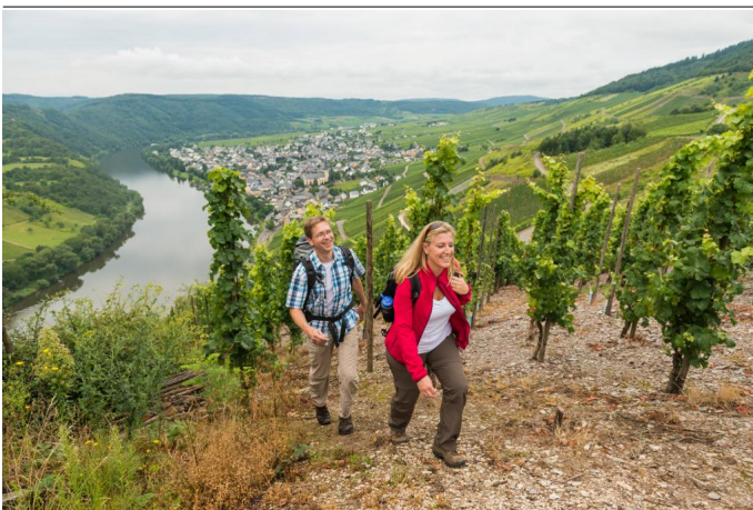
Blick aus den Weinbergen des Steffensbergs auf Kröv